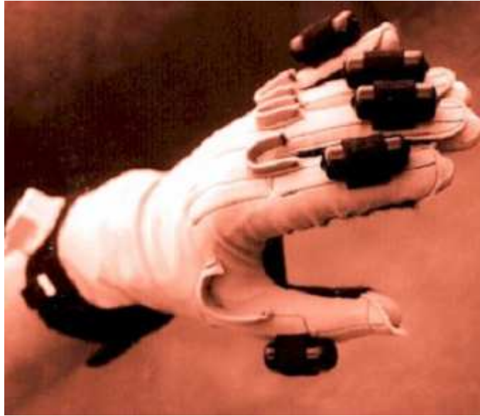
Abbildung 7: Datenhandschuh CyberGlove mit Vibrationselementen CyberTouch

beeinträchtigen. Eine Lösung für dieses Problem besteht darin, den Datenhandschuh mit Vibrationselementen (z.B. Immersion CyberTouch) auszustatten. Ein plastischerer Eindruck lässt sich mit einem Exoskelett (z.B. Immersion CyberGrasp) erzielen, durch das beim Berühren eines Objekts entsprechende Gegenkräfte vermittelt werden.