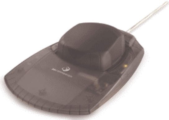
Abbildung 2: 3D-Maus CadMan

Die Möglichkeiten zum Einsatz von Virtueller Realität am CAD-Arbeitsplatz beschränken sich nicht nur auf die Unterstützung der visuellen Wahrnehmung. Zusätzlich sind Interaktionsgeräte verfügbar, die den Tastsinn ansprechen, etwa das PHANToM von SensAble (Abbildung 3). Damit wird vom Rechner eine haptische Rückmeldung erzeugt, so dass man den Eindruck erhält, dass die Oberfläche des Modells einen Widerstand leistet, wobei auch Informationen über z.B. Flexibilität und Rauigkeit vermittelt werden.