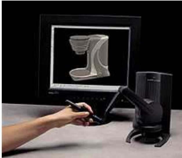
Abbildung 3: Haptische Rückmeldung mittels PHANToM

Die Möglichkeiten zum Einsatz von Virtueller Realität am CAD-Arbeitsplatz beschränken sich nicht nur auf die Unterstützung der visuellen Wahrnehmung. Zusätzlich sind Interaktionsgeräte verfügbar, die den Tastsinn ansprechen, etwa das PHANToM von SensAble (Abbildung 3). Damit wird vom Rechner eine haptische Rückmeldung erzeugt, so dass man den Eindruck erhält, dass die Oberfläche des Modells einen Widerstand leistet, wobei auch Informationen über z.B. Flexibilität und Rauigkeit vermittelt werden.