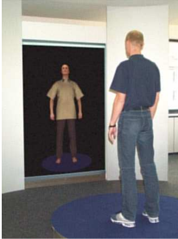
Abbildung 8: Virtueller Spiegel (aus [6])

Technisch vergleichsweise einfache Lösungen sind webbasierte Anwendungen, mit denen ästhetische Merkmale (z.B. bei Nike) oder Ausstattungselemente (z.B. für den Smart) ausgewählt werden können. Das Konzept von Adidas geht über solche nach dem Baukastenprinzip strukturierten Angebote hinaus. Dabei wird das Ziel verfolgt, weitere Produkteigenschaften wie die der Passform zu individualisieren. Dazu werden in ausgewählten Kaufhäusern sogenannte Fußscanner bereitgestellt. Mit ihnen werden individuelle 3D-Modelle erzeugt, die die Grundlage für die kundenspezifische Auslegung des Produkts bilden.