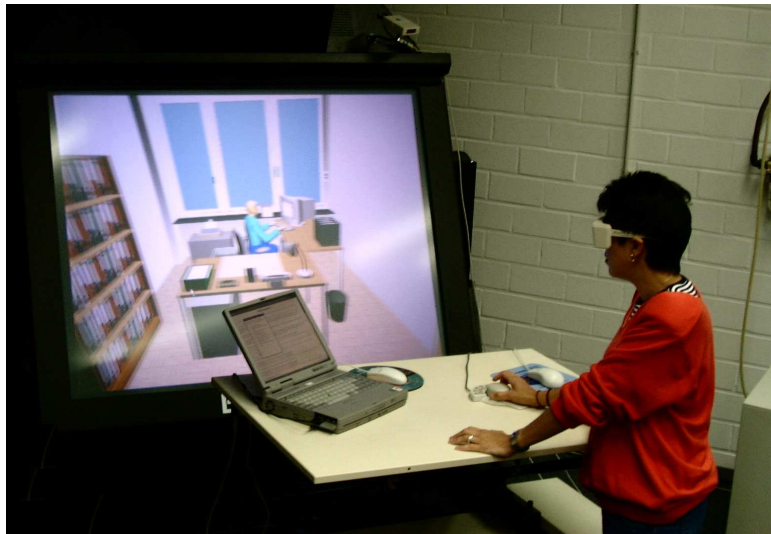
Abbildung 4: Projektionstisch Barco Baron

Eindruck vermittelt. Wie im Szenario zum CAD-Arbeitsplatz lassen sich auch in dieser Umgebung verschiedene Interaktionsgeräte einsetzen, in Abbildung 4 wird zur Navigation eine 3D-Maus verwendet.