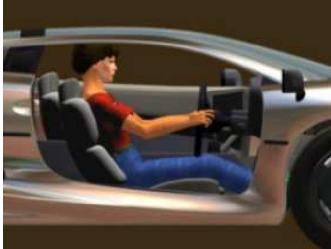
Abbildung 1: Menschmodellierung am Beispiel Anthropos

Ausgangspunkt dieses Szenarios ist der klassische CAD-Arbeitsplatz, der mit einem leistungsstarken PC, CAD-Bildschirm und konventionellen Eingabegeräten (Maus, Tastatur, Grafiktablett) ausgestattet ist. Um welche Arbeitsmittel kann ein solcher Arbeitsplatz ergänzt werden, damit das aktuell bearbeitete Projekt in einer möglichst realitätsnahen Form dargestellt wird?