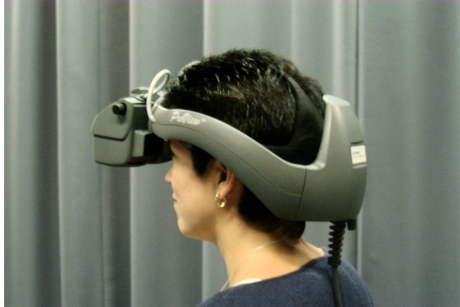
Abbildung 6: Head-Mounted-Display Kaiser ProView XL 50

HMDs werden in der Regel zusammen mit Tracking-Systemen (z.B. Polhemus FASTRAK oder Ascension Flock of Birds) eingesetzt. Dabei wird ein Sensor an das Gerät angebracht, über den die Kopfbewegungen gemessen werden. Auf dieser Grundlage wird die Perspektive an die jeweilige Blickrichtung des Anwenders angepasst, womit die Darstellung zusätzlich an Realitätsnähe gewinnt. Auf diese Weise kann der Anwender z.B. direkt in die Situation einer Arbeitsperson hineinversetzt werden, etwa der eines Fahrzeugführers, um die Sehbedingungen aus dessen Perspektive zu beurteilen.